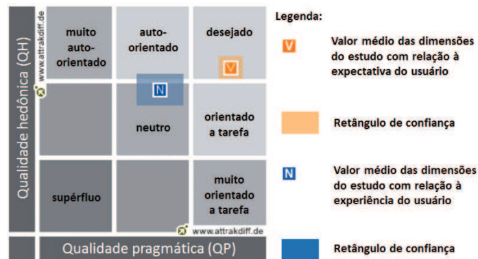
Figura 2. Valores médios das dimensões e retângulos de confiança

Os resultados da avaliação da experiência do usuário podem ser obtidos utilizando a ferramenta online do Attrakdiff 3 . Neste caso, dois especialistas em usabilidade analisaram os resultados das avaliações. Em um contexto industrial, os próprios desenvolvedores de software poderiam analisar esses resultados, já que são de fácil interpretação. Para caracterizar os resultados da avaliação da experiência do usuário sobre o Swarm, algumas análises serão descritas a seguir. A Figura 2 apresenta tanto a relação dos valores médios das dimensões QP (Qualidade Pragmática) e QH (Qualidade Hedônica), quanto os retângulos de confiança do Swarm, focando na relação existente entre a expectativa e a experiência do usuário. Esta figura foi gerada conforme a metodologia do AttrakDiff [4].