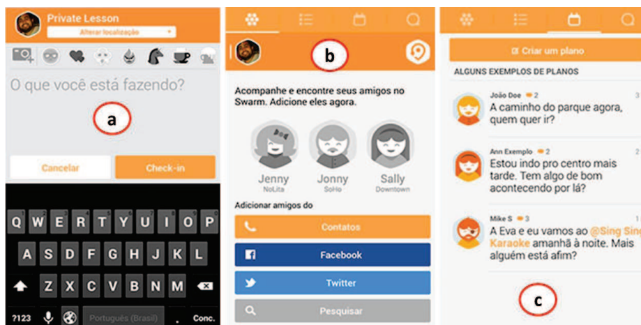
Figura 1. Tela do aplicativo Swarm.

Em um exemplo de uso comum, um usuário do Swarm pode realizar um check-in em um restaurante. Além disso, o usuário pode comentar sobre o que está fazendo no restaurante, por exemplo: se foi degustar seu prato favorito ou se foi ao restaurante comemorar o aniversário de um amigo. Isto pode ser realizado na tela apresentada na Figura 1.a. O aplicativo ainda permite que os usuários possam adicionar amigos de outras redes sociais (tela representada na Figura 1.b). Além disso, o aplicativo adicionou uma nova funcionalidade: “Criar um Plano”. Esta funcionalidade permite que os usuários criem um plano para uma atividade (realizar uma caminhada em um parque, por exemplo) e convide outros amigos para participarem juntos (tela representada na Figura 1.c).